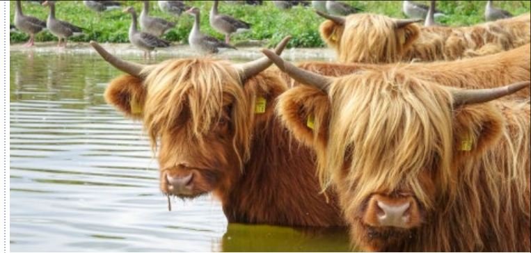
Beweidung der Inseln