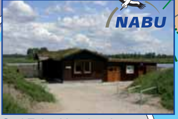
Carl Zeiss Vogelstation Öffnungszeiten: Mi, Do, Sa, So und Feiertage 10-16 Uhr