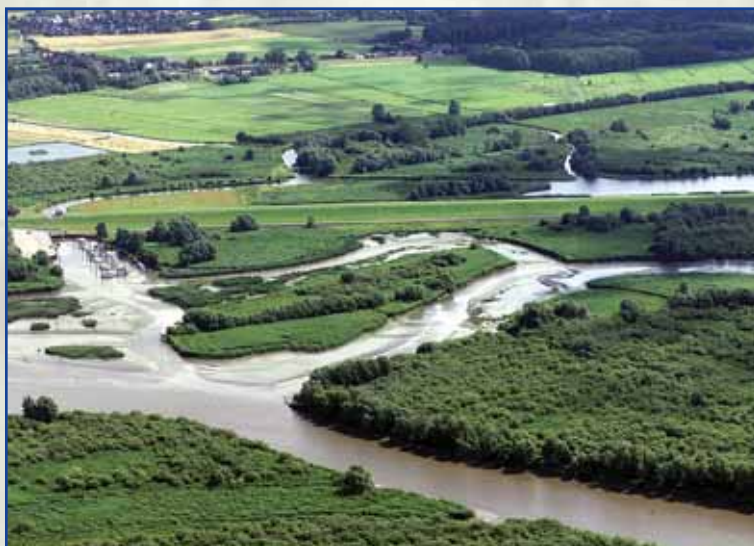
Blick auf Ästuar, Deich und Haseldorfer Binnenele

Der Hauptdeich kann in seiner gesamten Länge betreten werden. Man kann aus etwa 8 Metern Höhe weit in die Flächen hineinsehen und Tiere beobachten. Außerhalb der gekennzeichneten Wege darf das Naturschutzgebiet nicht betreten werden. Denn nur wenn der Mensch nicht stört, lassen sich Tiere aus der Nähe beobachten.