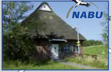
NABU Naturzentrum Scholenfleth Öffnungszeiten: April bis Sept., So 11-16 Uhr