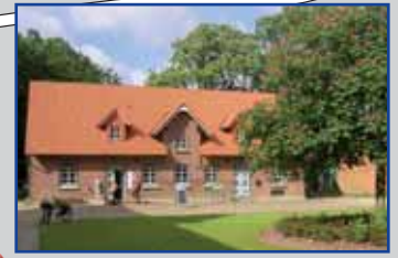
Elbmarschenhaus Tel. 04129/95549490 Öffnungszeiten: tägl. 10-16 Uhr