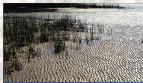
Süßwasserwattfläche mit Binsen

Parallel zum Ufer ist im gesamten Ästuar eine deutlich erkennbare Zonierung der Lebensräume entstanden. Direkt am Fluss ist bei Niedrigwasser ein breiter Streifen vegetationsfreier Wattflächen zu sehen. Es folgen eine schmale Zone mit Binsen und ausgedehnte Schilfbestände. Weiter zum Land hin wachsen krautige Blütenpflanzen, die schließlich in ein Weidengebüsch übergehen. Die unterschiedlichen Lebensräume werden von Arten besiedelt, die mit der Wasserdynamik im Ästuar leben können. Landtiere können Überflutungen, Wassertiere das Trockenfallen kurzfristig ertragen. Arten wie Vögel oder Fische sind sehr gut beweglich und weichen aus.